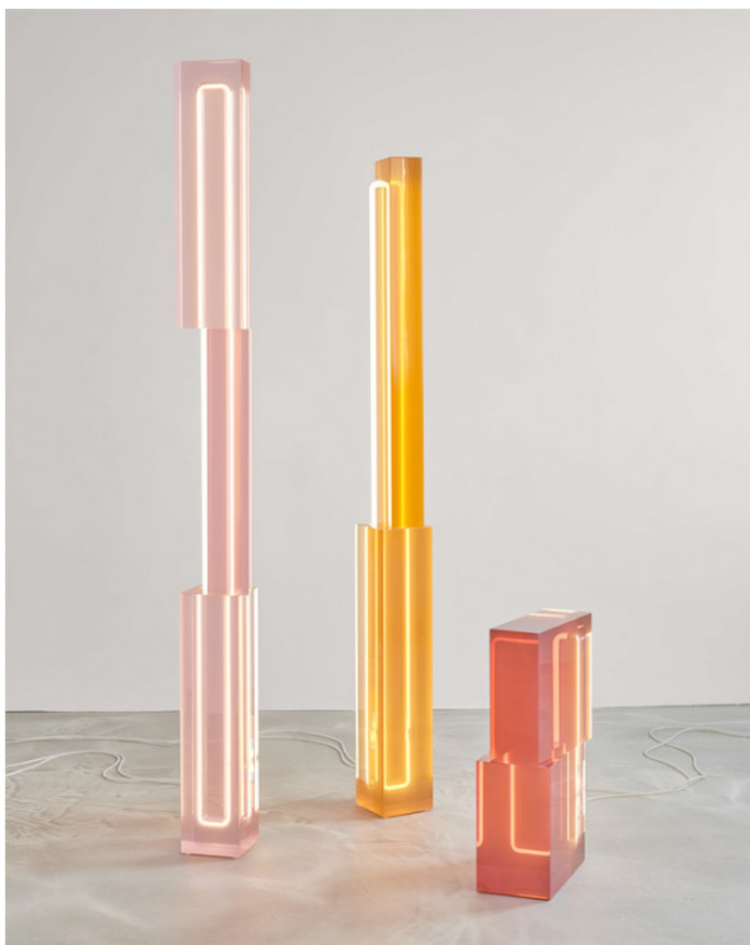
TOTEM DE SABINE MARCELIS PARA SIDE GALLERY.

Diseño y arte contemporáneo y del siglo XX junto a piezas de vidrio, cerámicas, arte tribal, antigüedades y joyas: todo eso es lo que vamos a encontrar en la 13ª edición de PAD Londres , una feria que, año tras año, se ha convertido en un punto de encuentro para coleccionistas, galerías, diseñadores y aficionados. Este año en Berkeley Square, donde se ubicará la feria, se reunirán un total de 68 galerías internacionales que representan a un total de 14 países y que, del 30 de septiembre al 6 de octubre, nos ofrecerán un viaje por el arte y el diseño pasando por diferentes épocas y disciplinas.