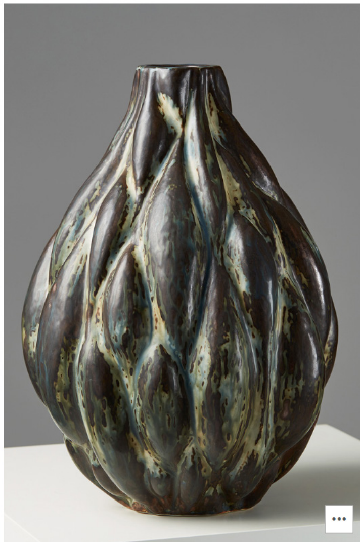
FOTO: © ÅSA LIFFNER / AXEL SALTO / CORTESIA DE MODERNITY STOCKHOLM